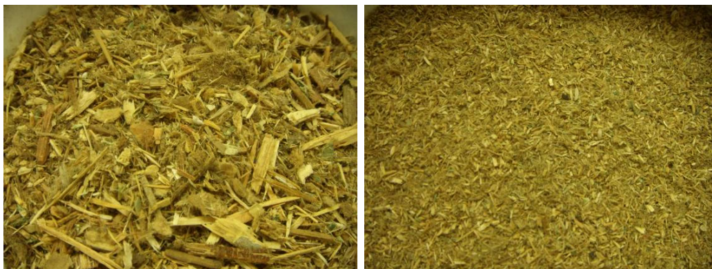
Figuur 2 Links: Houtafval (0-15 mm); Rechts: Verkleind < 2 mm